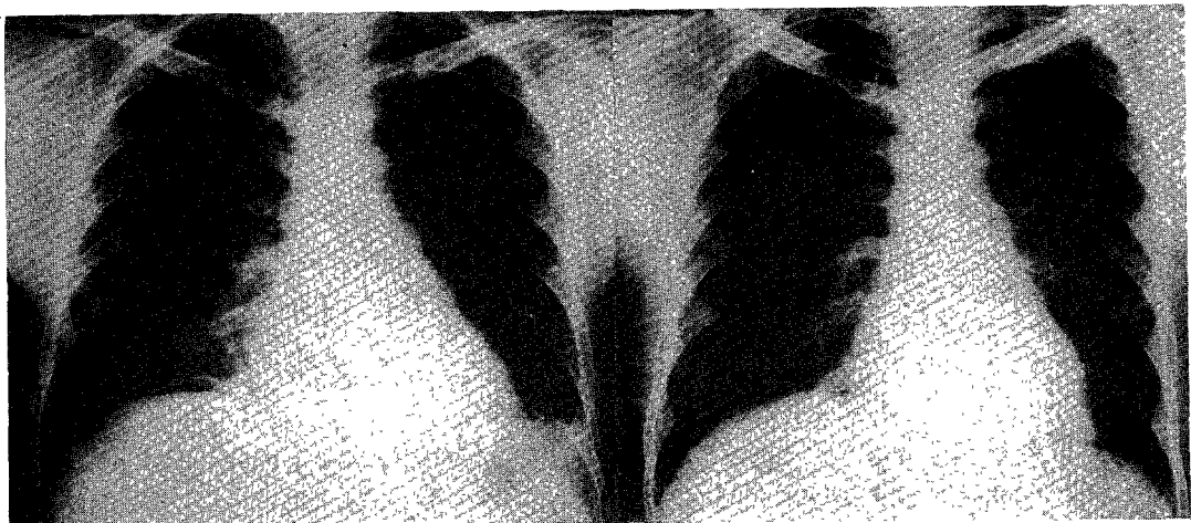
Fig. 1. Pneumoperitoneum and pleural effusion.