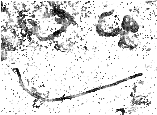
Fig. 1. Upper: Microfilariae stained with Giemsa stain, \times 400 . Lower: A slender microfilaria stained with Giemsa stain after fixation in 2% formalin solution, \times 400 .