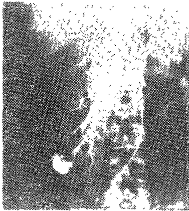
Fig. 2. The segmental branches of anterior main artery reveals marked stretched, elongated and displaced to the upward and downward and round indentation due to radiolucent large cyst like mass in the upper and middle pole area of the right kidney by selective right renal arteriography.