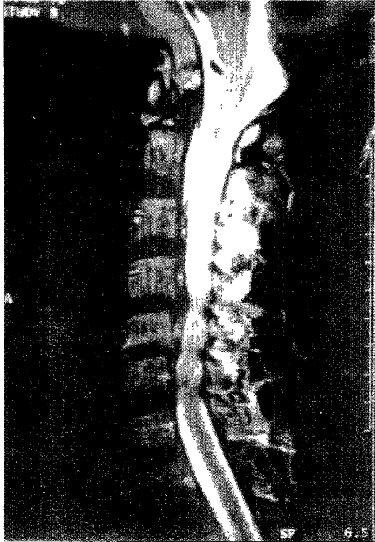
Fig. 1. Preoperative MR Sagittal view. View shows cord compression at C4-5-6

경우이며 poor을 보인 예는 경추 골절과 동반된 예로써 수술결과와는 무관하며 척수 손상으로 비롯된 결과로 사료되어 전반적으로 양호한 결과로 생각된다.