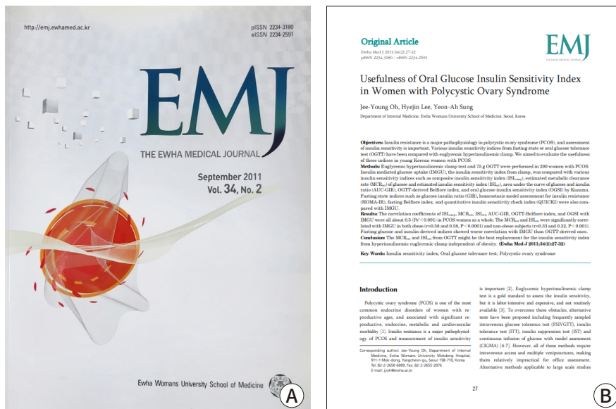
Fig. 2. Changed feature at 2011. (A) Cover page, (B) paper inside.