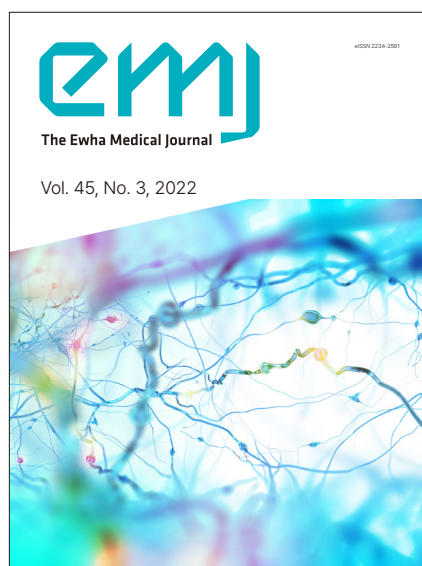
Fig. 3. Changed cover page at 2022.

가고자 2022년 7월호를 기점으로 전면 개편하게 되었다. 우선 변화에 순응하는 학술지명의 디자인변경을 시행하게 되었다(Fig. 3). 보다 미래지향적이고 활기차며 국제적인 도약을 지향하는 형태의 최신 트렌드를 고려한 디자인이 채용되었다. 과거 인쇄물로 논문을 접하던 독자보다 컴퓨터나 모바일 디바이스를 통해 논문을 접하는 독자층이 확대되는 것을 감안하여 학술지 내지의 편집형태를 2단 편집에서 1단 편집으로 변경하여 가독성이 좋고 시야의 피로감이 적은 형태로 재개편하였다. 이러한 변화는 새롭게 오픈되는 학술지 홈페이지( https://www.e-emj.org )에서 경험할 수 있다.