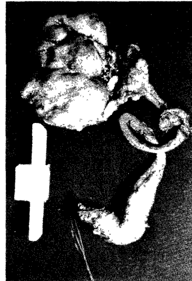
Fig. 4. Gross specimen shows dilatation of lower ureter.