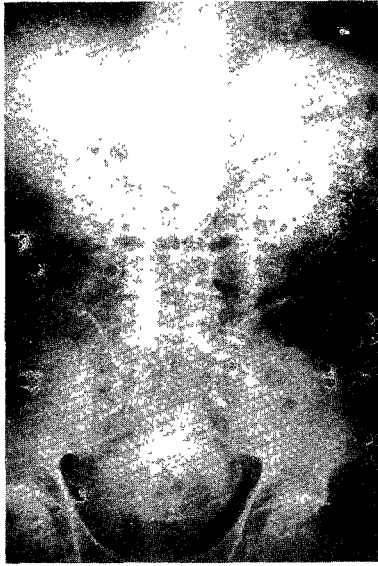
Fig. 1. I.V.P. showing good delineation of pelvis of left kidney but no dye in pelvis of right kidney.