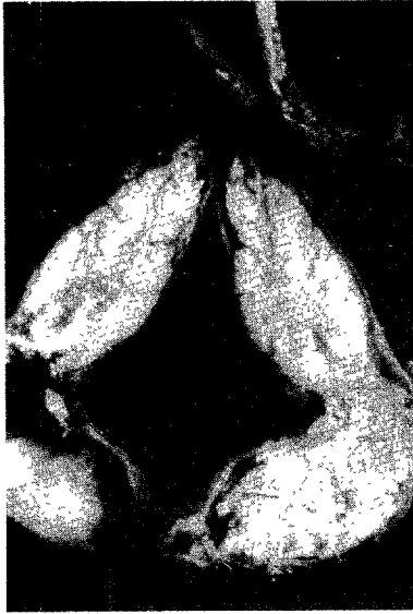
Fig. 5. Close up view of tumor on lower ureter which is opened.