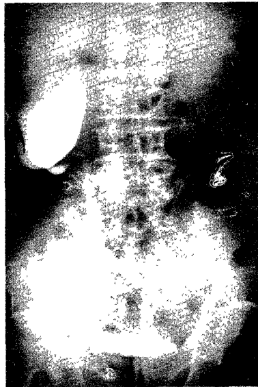
Fig. 2. Right retrograde pyelogram, showing typical filling defect in right lower ureter.