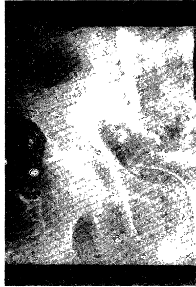
Fig. 3. Close up view of right lower ureteral area.