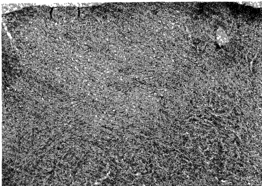
Fig. 2. There is no epidermis. The tumor mass is located predominantly in upper and mid-dermis and composed of spindle shaped cells ( H-E stain, \times 40 ).

관찰되었으나 비정형적이고 불규칙한 거대세포는 찾아볼 수 없었다 ( Fig. 2-5 ).