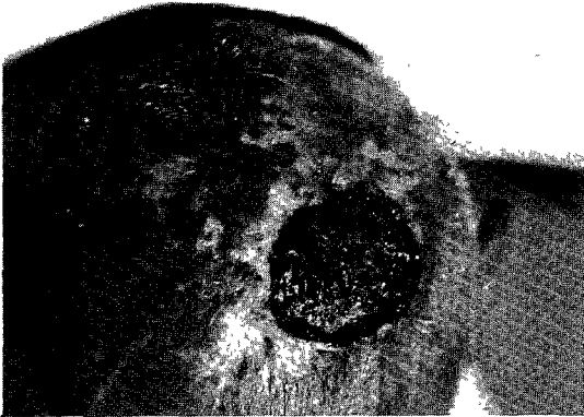
Fig. 1. A well-circumscribed round ulcer covered by granulating tissue and serosanguinous fluid on left parietal area.

병리조직학적 소견 : 궤양부에서의 조직검사소견은 표피는 소실되어 있었고 종양은 주로 진피의 상부와 중부에 위치하였으며 다형태의 방추형세포가 차륜상배열을 하고 있었다. 종양내에서 거대세포는 매우 드물게