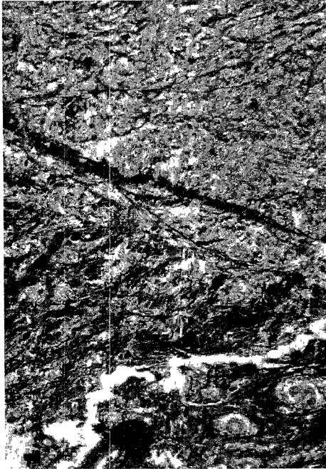
Fig. 5. The reticulum fibers decrease in the tumor mass (Reticulum stain, \times 40 ).