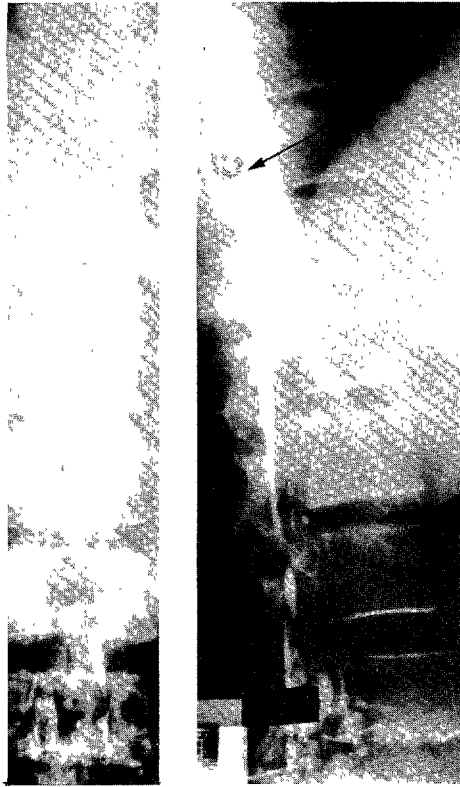
Fig. 1. Partopaque myelogram shows total block of dye column at T_5 level.

은 급성및 만성에에서 조기진단과 적절한 수술요법으로 증상의 호전을 기할수 있는 질환이다.